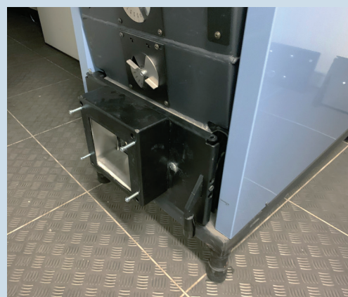
Pelletsluckan på Bonus Light (tillbehör).